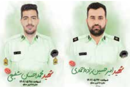
شهید محمدحسین شفیعی شهید امیرحسین زاده قندی

جمعه گذشته اصفهان ایستن خبر تلخی بود که در پی حادثه‌ای سنگین و سیاه رخ داد.